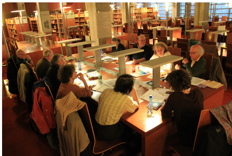
Atelier Arpentage à la BNF

Concernant la formation professionnelle, l'année 2013 a permis la consolidation de notre offre sous la forme d'un répertoire de formations pour l'année 2014. Un groupe de formateurs, issus des associations membres de Peuple et Culture, s'est constitué pour assurer la conception et l'animation de formations en lien avec les pratiques qui lui sont propres : analyse financière et économique, techniques de débat, réflexions et pratiques autour du jeu, méthodes de pensée et d'action en collectif, conception et animation de balades urbaines et ateliers de rue, etc.