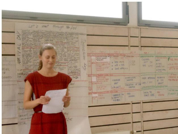
Formation d'animateurs/trices d'échanges, session de Sète

La coopération institutionnelle , ou réunion de partenaires internationaux, réunit annuellement les partenaires européens et internationaux de Peuple et Culture, afin de les mettre en réseau, de définir une stratégie politique commune et de monter des projets d'échanges interculturels.