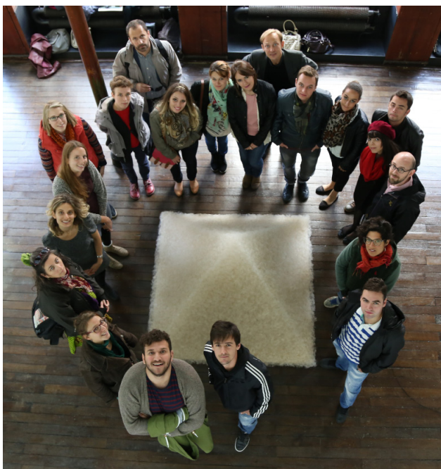
« Et si l'UE n'existait pas ? », session de Strasbourg